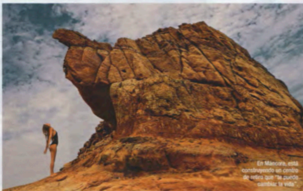
En Mancos, está construyendo un centro de retiro que "le puede cambiar la vida".